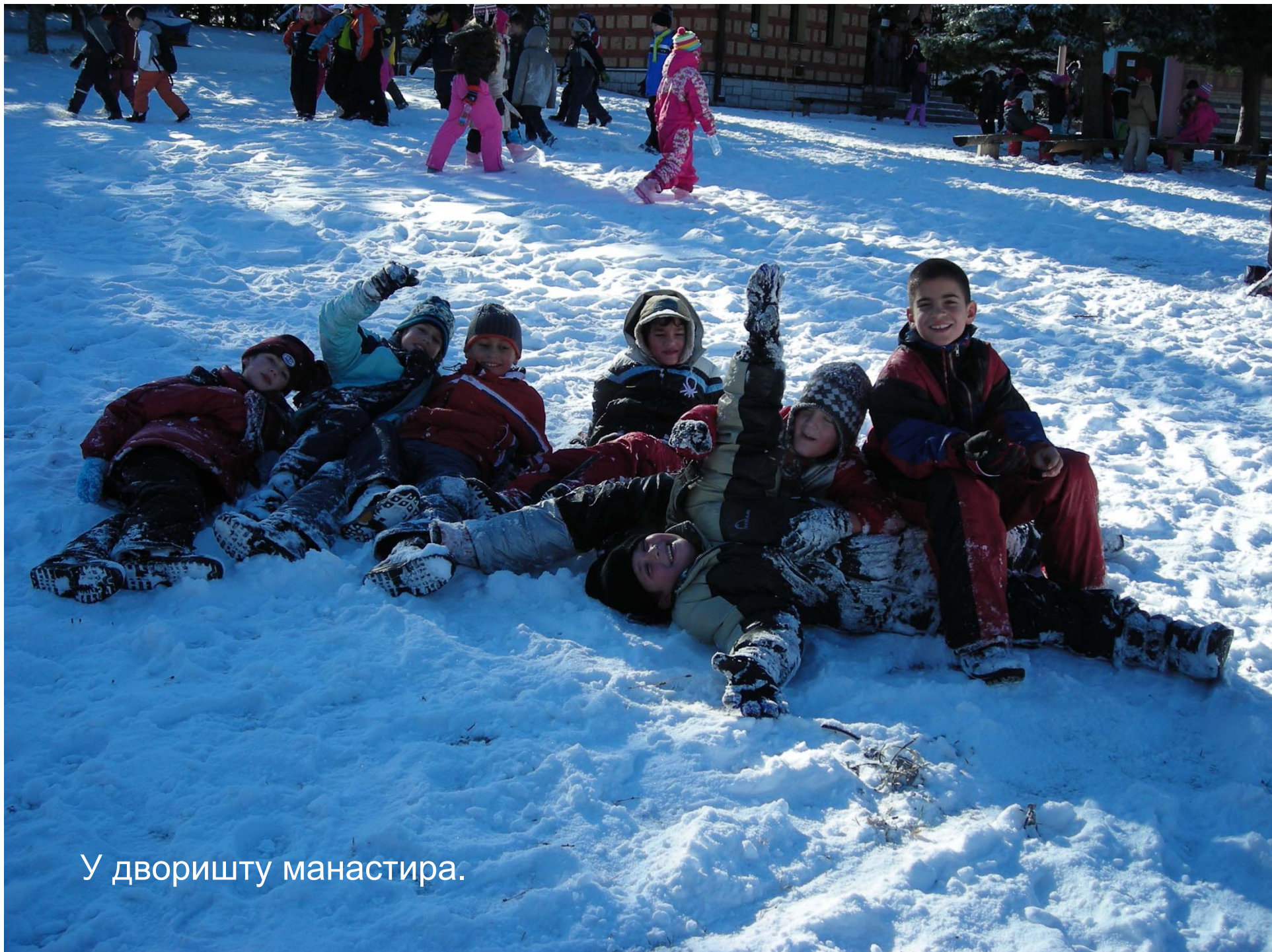
У дворишту манастира.