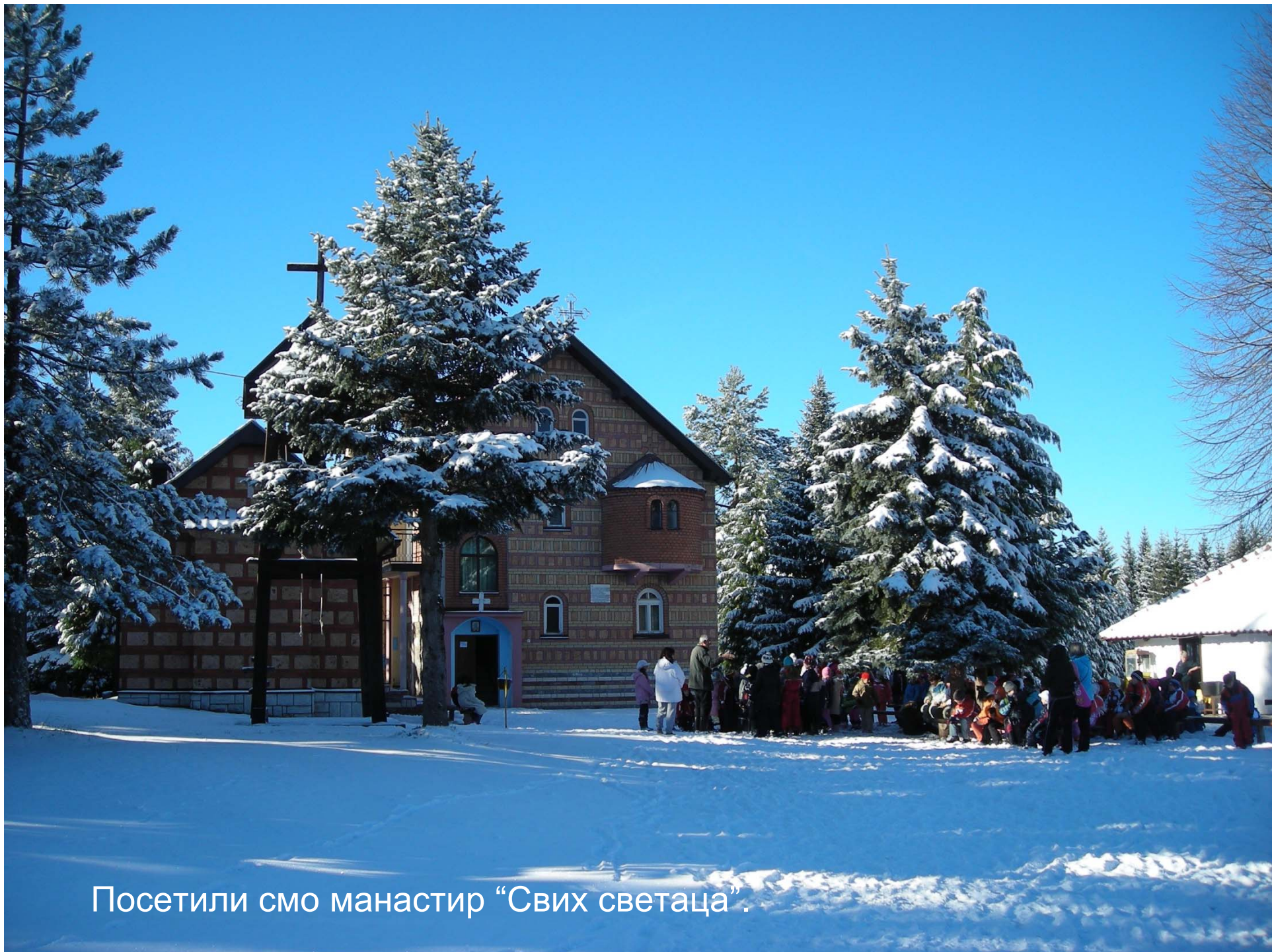
Посетили смо манастир “Свих светаца”.